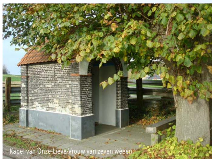
Kapel van Onze-Lieve-Vrouw van zeven weeën.