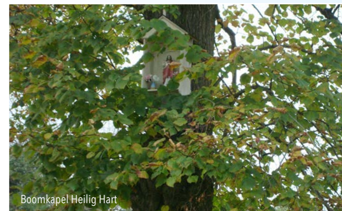
Boomkapel Heilig Hart