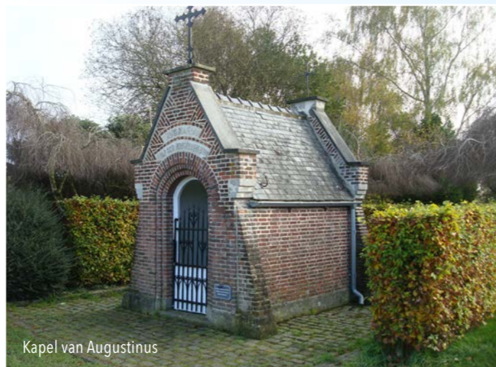
Kapel van Augustinus