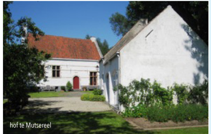
hof te Mutsereel

Kort vóór 1500 kocht de abt de heerlijkheid en in 1511 werden de laatste heerlijke rechten afgestaan. In 1797 werd het goed aangeslagen en verkocht; sinds 1982 wordt het bewoond door Erik Wauters , die het liet restaureren.