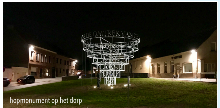
hopmonument op het dorp

Een dries is een ontgonnen stuk land met midden grasperk voor de dieren en rondom de huisjes en hoeven.