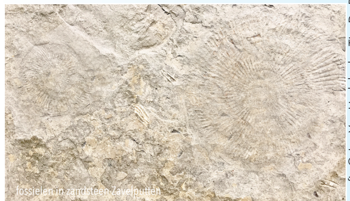
fossielen in zandsteen Zavelputten

We zitten hier aan de rand van het Kravaalbos . Hier ligt de zandsteen over 3 hectare uitgespreid. De zandsteen behoort tot de laag van Balegem en Lede, die in Frankrijk aan Cap Gris Nez haar grijze rotsmassa's boven de zee uitsteekt. Hier werd dus de zandsteen uitgegraven, vandaar de vele putten en bulten. Toen 40 miljoen jaar geleden de zee tot hier reikte , kwamen in het subtropische water allerlei vissen, schelpdieren en inktvissen voor, waarvan men nu in de zandsteen de fossiele resten aantreft. Ondertussen is deze plaats in privé handen en een omheining met camerabewaking verbiedt de toegang.