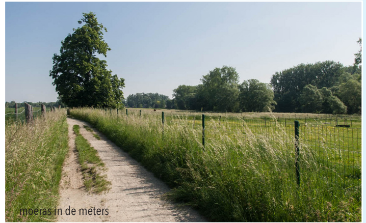
moeras in de meters

Vanaf de plaats waar het Hof te Moortere stond hebben we zicht op Het Moortere of moeras van Meldert (de meters= een moerassig gebied; Metersbeek). Hier bevonden zich tot het einde van de 19de eeuw de Meetervijvers , waarschijnlijk de slenken van de eerste steengroeven. In de geschiedenis is er een eerste vermelding van de naam Hof te Moortere in 1160. Hier op de motte, die omringd was met vijvers, verbleven de Heren van Meldert (o.a. Ridder Iwijn van Meldert in 1256). De naam 'Meetersstraat' zou dus ontleend zijn aan dit oude Hof te Moortere. In de 15e eeuw geraakte het geslacht 'Van den Moortele' in financiële moeilijkheden en in 1370 werd het hof eigendom van de abdij Affligem .