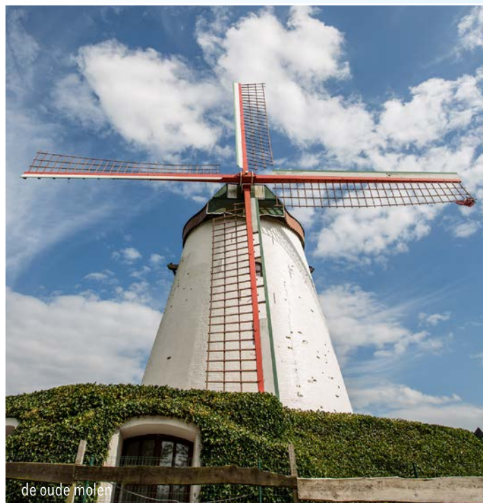
de oude molen