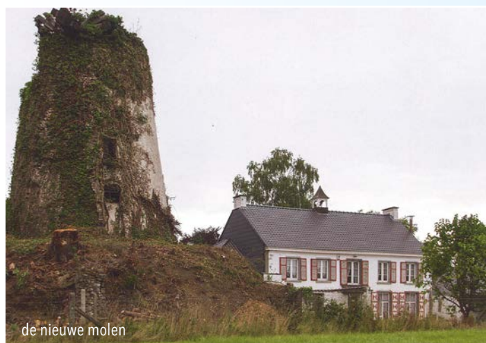
de nieuwe molen