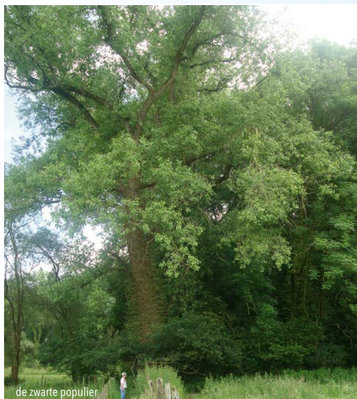
de zwarte populier

Deze boom bepaalt sedert vele jaren de administratieve grens tussen Vlaanderen en Brabant. Wegens historisch, volkskundige en sociaal-culturele waarde werd deze boom geklasseerd in 2009. Deze populier wordt ook 'Europese zwarte populier' genoemd en is een van de meest bedreigde boomsoorten in Europa .