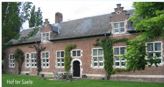
Hof ter Saele

Hof ter Saele in de Diepestraat werd in 1985-1986 grondig gerestaureerd. Het was de hoeve verbonden aan het verdwenen middeleeuws kasteel van Hekelgem . Het viel meermaals ten prooi aan vijandige legerbenden en in 1689, na actie van de Fransen bleven er enkel nog verkooldes muren over. Later werd het heropgebouwd. De gemeente Affligem koos als wapenschild het zegel van de schepenbank van het Hof ter Saele.