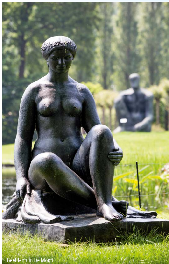
Beeldentuin De Montil