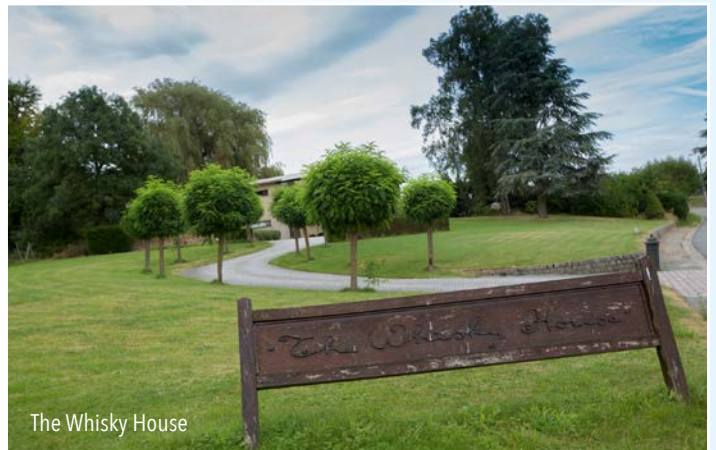
The Whisky House