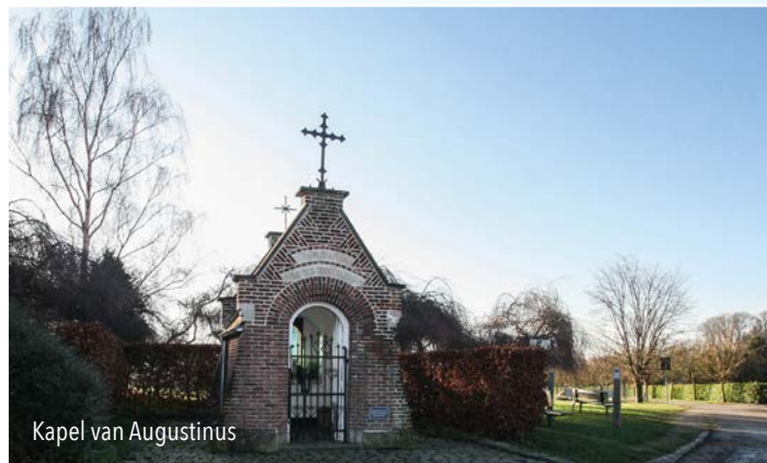
Kapel van Augustinus

De basis van de Montil ligt in de jaren 80, toen de voormalige melkerij omgevormd werd tot een feest- en sportcentrum. Later kwam er een congrescentrum bij. De opening van de beeldentuin dateert van het jaar 2000.