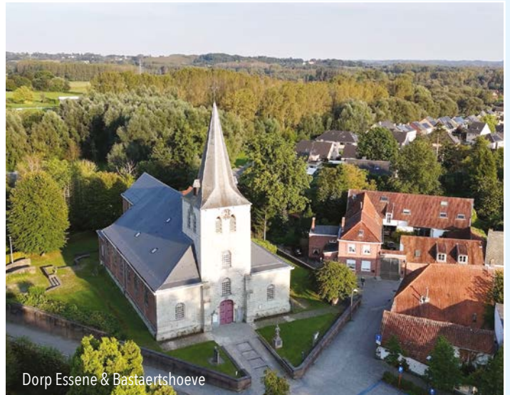
Dorp Essene & Bastaertshoeve

Het zendstation zendt op een frequentie in een bepaald VHF-bereik (very high frequency) rondom een signaal uit. Op een speciaal daarvoor bestemd instrument in de cockpit van een vliegtuig kan voortdurend worden gezien op welke radiaal (1-360 graden) van het radiobaken het vliegtuig zich bevindt.