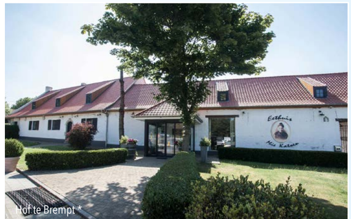
Hof te Brempt *

Het was waarschijnlijk de boerderij met woning voor de molenaars van de Bellemolen . Ook deze hoeve kwam in abdijbezit. Op het einde van de 16de eeuw was ze in zeer slechte staat en pas in 1768 volgde de heropbouw en veranderde de naam in Hof te Brempt. Thans is het een restaurant.